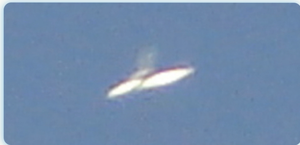
- Astronaves de Luz que vimos y fotografiamos desde Nuestro Hogar en Asunción, Paraguay -